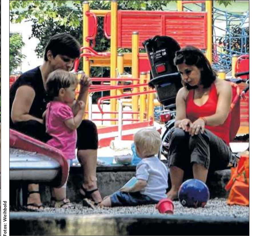
Viele Linzer haben den 32.000 Quadratmeter großen Volksgarten in der Linzer Innenstadt lieb gewonnen – von den Schachspielern bis zu den Kindern. 2012 steht ein Facelifting an.